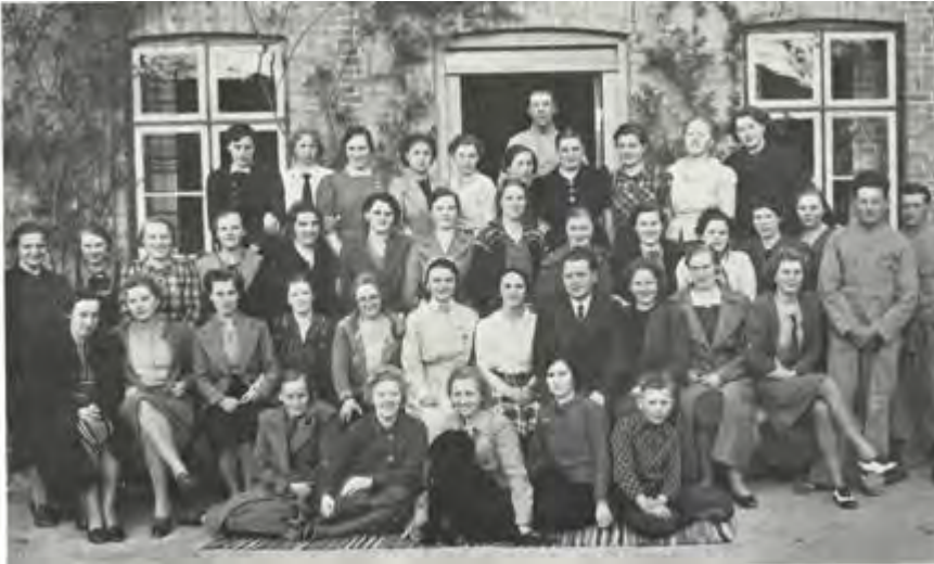
Sommerskolens Elever 1939 og Skolens praktiske Medarbejdere sammen med Ledelsen og Lærerpersonalet.