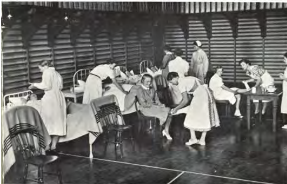
Den praktiske Sygeplejeundervisning.

Der findes kun en eneste "Mand" paa "Afdelingen". Han hedder "Jacob", og han er i enhver Henseende uimodtagelig for indtryk. Han er nemlig Træmand i Ordets mest bogstavelige Betydning, og han kan holde til mere, end de unge Piger maaske selv vilde synes om at komme ud for.