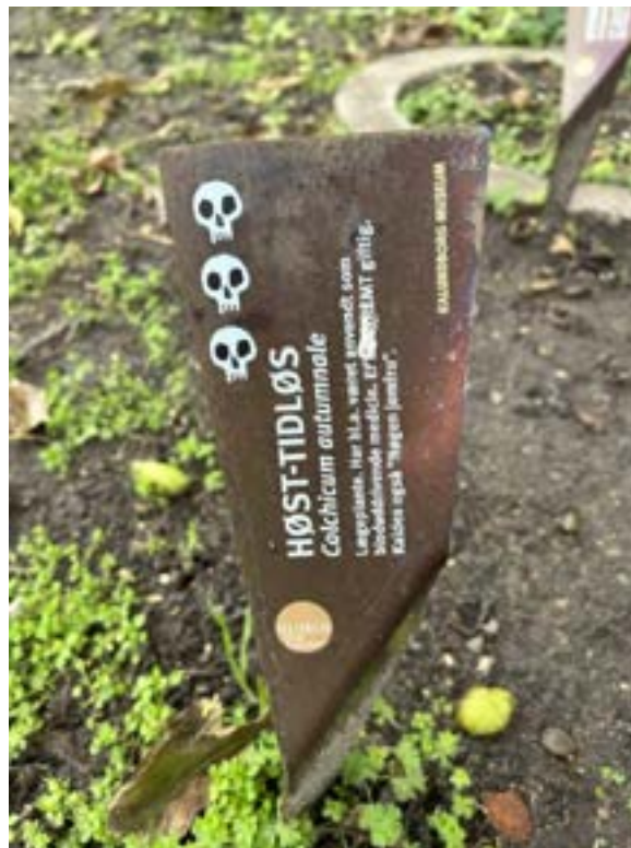
De nye skilte i Museumshaven.

I løbet af det sidste år har Havelauget gjort et kæmpe arbejde, og haven er kommet rigtigt godt i gang igen. Havelauget glæder sig til at se resultatet af deres arbejde til næste forår, og haveelskere og brugere af Kalundborg Museum kan se frem til at se en spændende og blomstrende have.