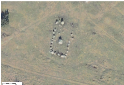
Langdyssen på Vesterlyng. Ortofoto.

Vesterlyng er en helt specielt landskabstype, og den er fredet. Området har være fælles græsningsareal lige siden middelalderen, og den anvendes stadig som sådan den dag i dag til fælles græsning af køer og heste. På Vesterlyng ligger der en gruppe på omkring en halv snes små rundhøje. Der er også en flot langdysse med skåltegn på kammerets dæksten.