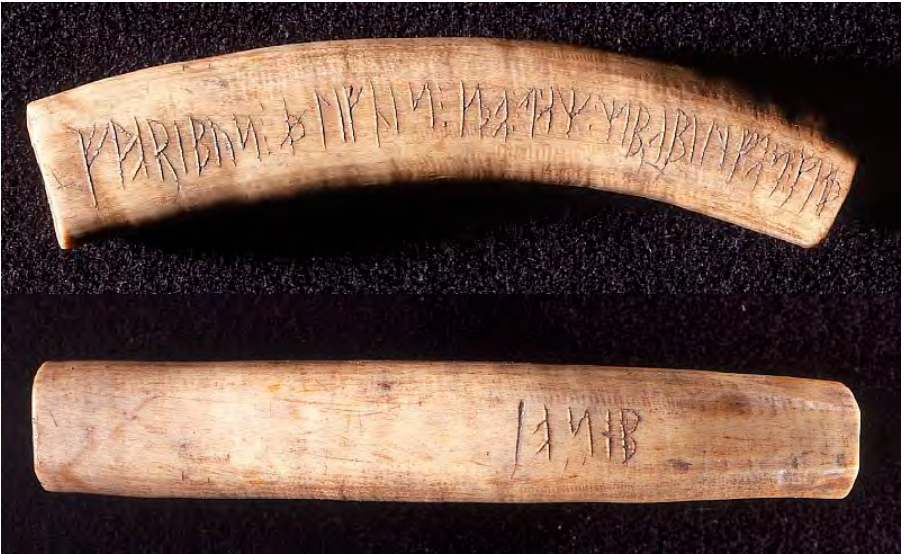
Runestaven fra Kalundborg.