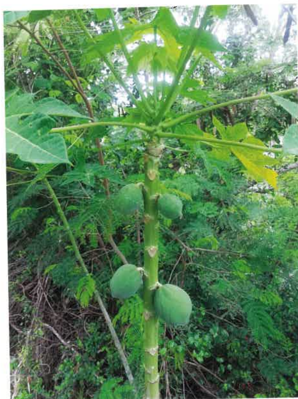
Fig. 3. Papaya fra provisionsgrunde, St. Thomas, 2018.