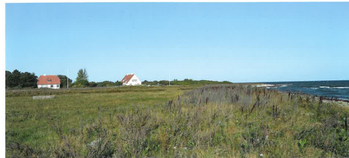
Fig. 5. Foto 2019, Havnemark. Bindingsværkshuset til venstre er det gamle gæstgiveri. Huset til højre er rester af sildesalteriet.

kostkilde for befolkningen. Dyrkningen af disse grunde fortsatte frem til midten af 1900-tallet. Disse afgrøder er dermed gået ind i den nuværende lokale madkultur på linje med majs mel og saltede fisk. Øerne er den dag i dag desuden stadig afhængige af en stor import af fornødheder fra omverdenen.