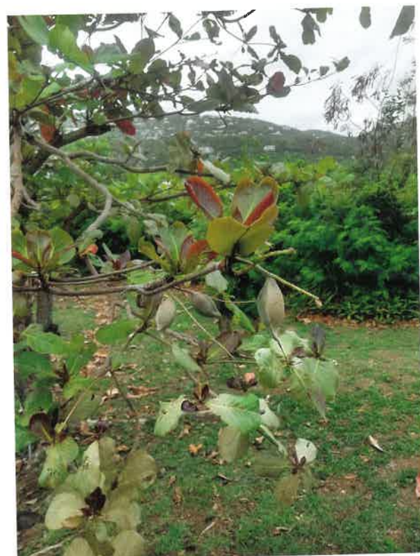
Fig. 4. Mandeltræ fra provisionsgrunde, St. Thomas, 2018.