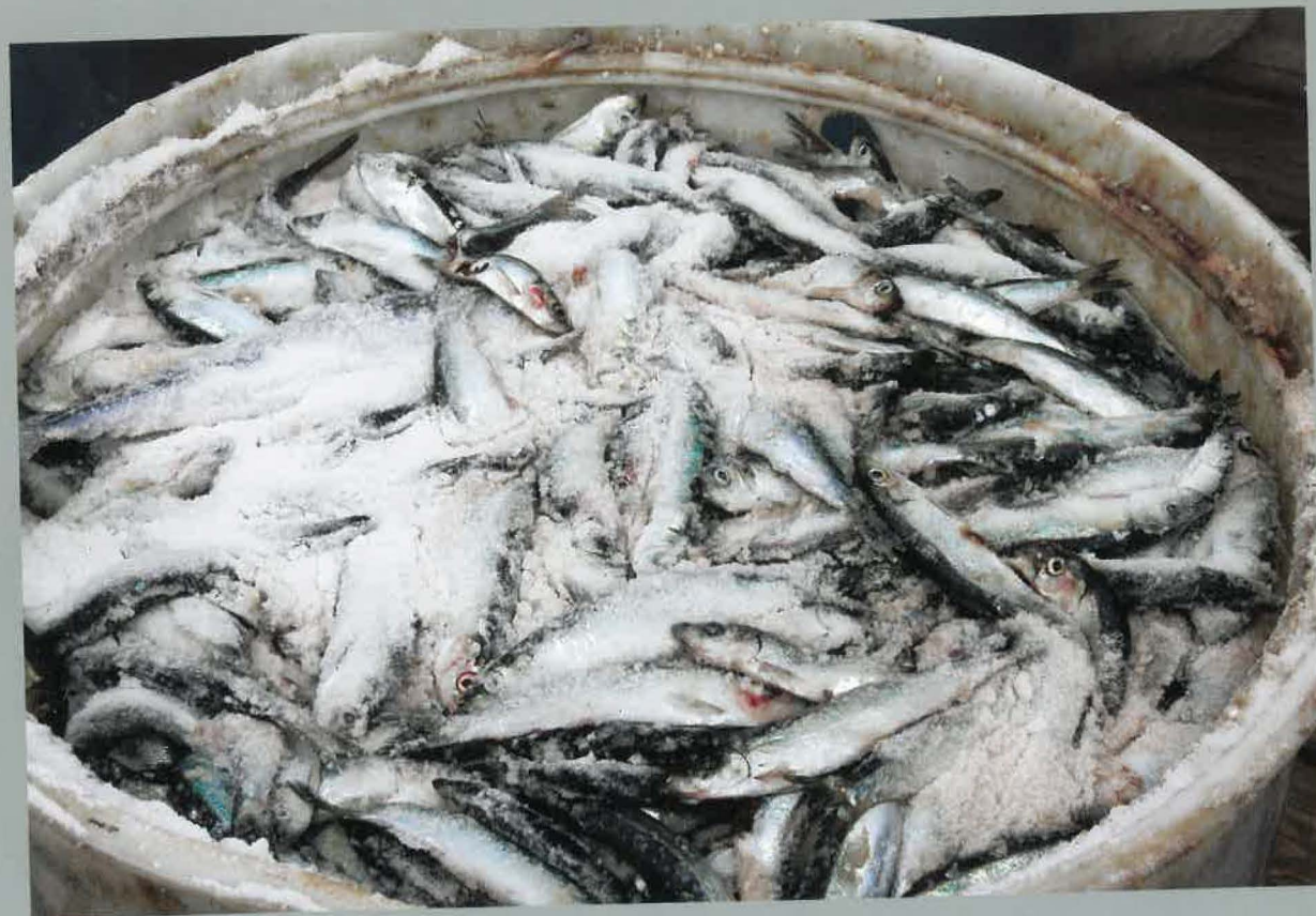
Sild i tande.