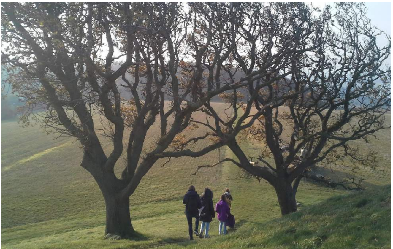
Udskolings elever i det Vestsjællandske landskab på bronzealderhøjen Vejrhøj.