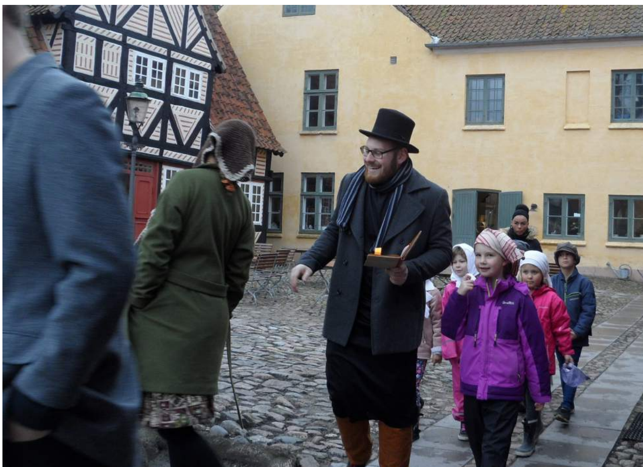
Partnerskabets mange samarbejds-konstellationer. Pædagogstuderende fra University College Sjællands pædagoguddannelse, Slagelse afprøver kulturformidlingsaktiviteter, som de selv har udviklet på o.klasser under et partnerskabsforløb på Holbæk Museum.2016.