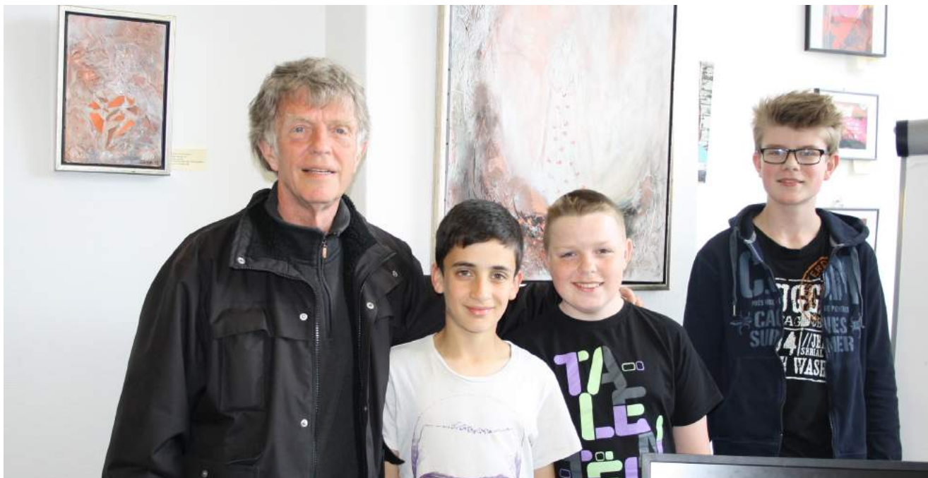
Fremtidsbattle. Eleverne præsenterer deres drømme og forslag til lokalområdet på fremtidscafeen under forløbet Unge Stemmer. Under forløbet samarbejdede udskolingselever med frivillige fra Museum Vestsjælland. Skoleåret 2014-2015.

Intensivt forløb over kortere tid. Særligt fokus på elevproduktion og elevinddragelse i valg af arbejdsform. Skovvejens Skole afdeling Ndr. Jernløse har siden 2015 samarbejdet med Skoletjenesten på Museum Vestsjælland om udvikling af valgfagsundervisning på udskolingsniveauet. Partnerskaberne har fokuseret på forskellige emner og fagområder, herunder historie, samfundsfag, billedkunst og kildearbejde. Museumsunderviseren og valgfagslæreren har arbejdet tæt sammen om valg af temaer, aktiviteter og inddragelse af eleverne i selvstændigt projektarbejde under forløbet.