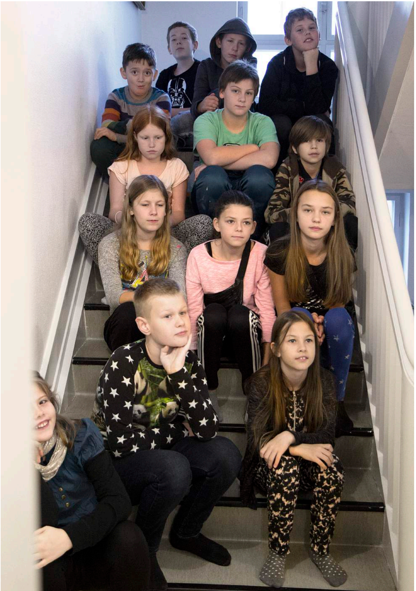
Partnerskabsskolen Årby Skole på Odsherreds Kunstmuseum under projektet KUNSTkammerater.