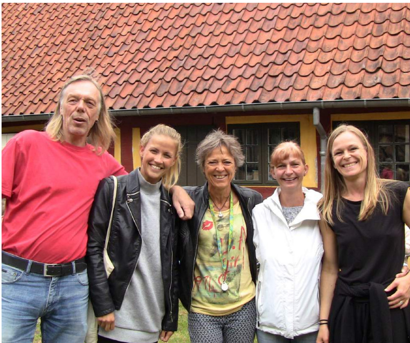
Lærerteam for 2. årgang fra Pedersborg Skole, elevfjernisering under partnerskabsforløb på Sorø Museum, 2016.

Museum Vestsjælland har et ansvarsområde, der dækker seks kommuner: Ringsted, Sorø, Slagelse, Holbæk, Kalundborg og Odsherred. Publikationen tager udgangspunkt i erfaringerne samlet under et treårigt udviklingsprojekt støttet af Slots- og Kulturstyrelsen, hvor det nyfusionerede museum i samarbejde med Skoletjenesten skulle udvikle en fælles Skoletjeneste for museets 11 besøgssteder - en organisationsudvikling, hvor partnerskabssamarbejde med lokale skoler har spillet en central rolle.