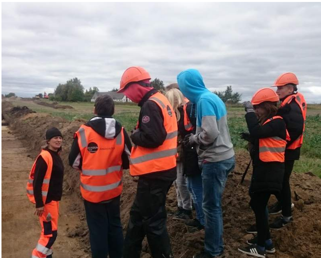
Skovvejens skole, Afd. Ndr. Jernløse. Skoleåret 2016-2017. Ude i kulturlandskabet med en af Museum Vestsjællands arkæologer på en igangværende udgravning under partnerskabet, Today in History- Kult, kunst og kilder (tværfagligt valgfag).

Modellen er blevet brugt særligt i forbindelse med tværfaglig valgfagsundervisning og i forbindelse med projektuger. Her har museumsunderviseren og læreren udviklet partnerskabsforløbet i fællesskab, og de har koordineret, hvordan partnerskabets forskellige elementer skal indgå i årets valgfagsundervisning eller projektuge på skolen. Afviklingsfasen har typisk været spredt over en uge og op til et par måneder. Mens den fleksible model ofte inddrager et helt lærerteam over et helt skoleår, involverer fordybelsesmodellen typisk en eller to lærere på et enkelt fag, som samarbejder med museumsunderviseren.