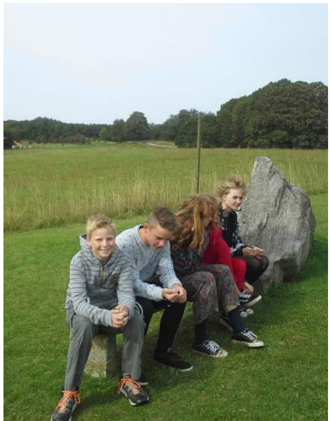
Skovvejens Skole, afd. Ndr. Jernløse. Skoleåret 2015-2016. Valgfagshold i billedkunst oplever familien Swanes kunstnerhjem på Malergården under partnerskabsforløbet Kunstnerens Univers, inspirationskilder.