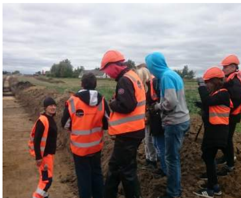
Skovvejens skole, Afd. Ndr. Jernløse. Skoleåret 2016-2017. Ude i kulturlandskabet med en af Museum Vest-sjællands arkæologer på en igangværende udgravning under partnerskabet, Today in History- Kult, kunst og kilder (tværfagligt valgfag).

Museets eksisterende forløb vælges af de enkelte lærerteams i samråd med museumsunderviseren og kan tilpasses for at imødekomme ønsker om for eksempel særlig vægtning af bestemte emneområder eller elementer i et forløb.