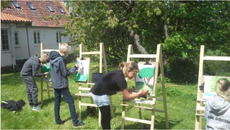
I Kunstnerens fodspor. 4. årgang fra Pedersborg Skole undersøger naturen som inspirationskilde og prøver kræfter med malerkunst på Malergården. Skoleåret 2015-2016.