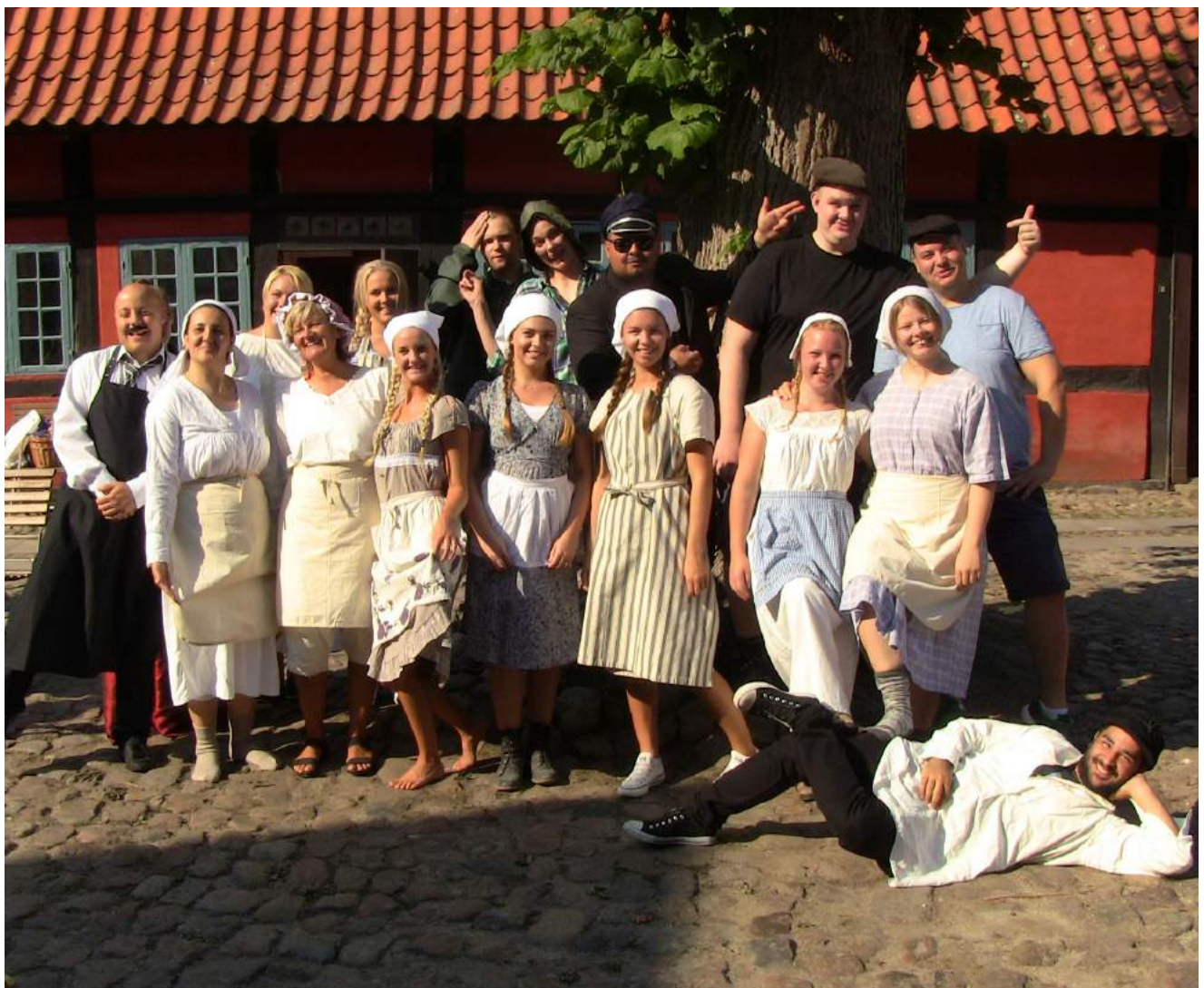
PAU-studerende fra SOSU Sjælland Holbæk gør klar til at tage imod o. klasser på Holbæk Museum. Efteråret 2016.