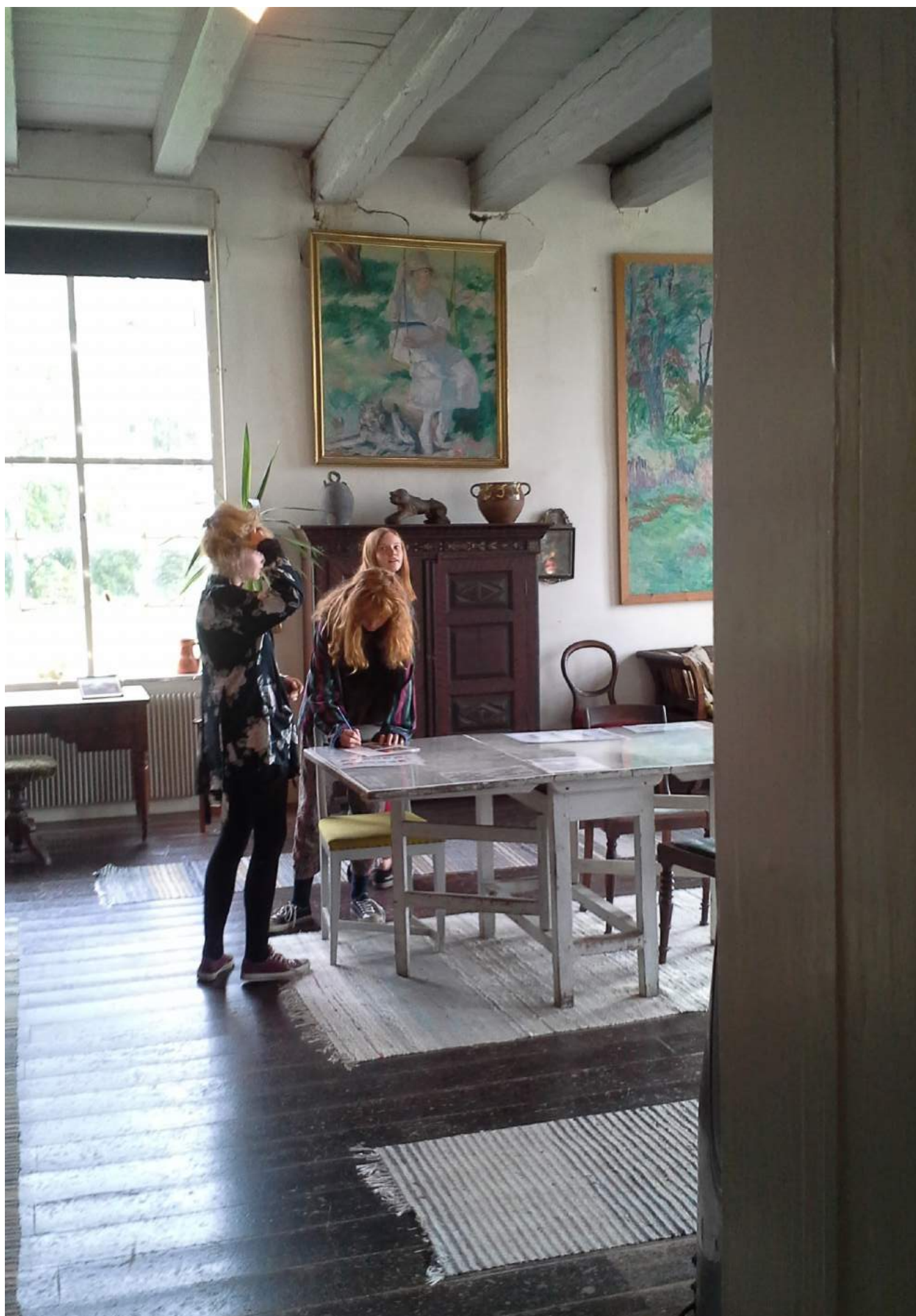
Valgfagselever i billedkunst undersøger inspirationskilder gennem familien Swanes kunst og hverdag på Malergården i Grevinge.