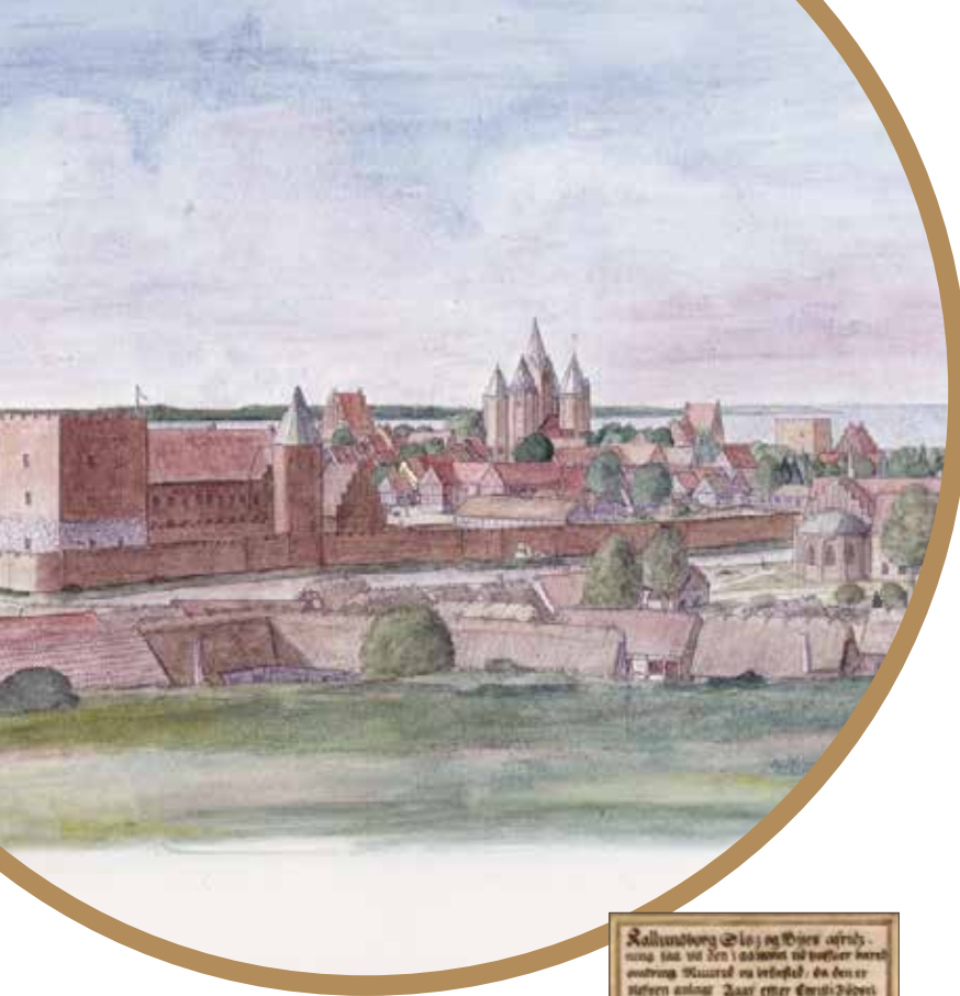
Kalundborg Slot og Byen omkring 1650. Selve Slotet og Byen er bygget af Esbern Snare omkring 1100 og 1200. Den er senere udvidet. Bortset fra den er resten senere. Bortset fra den er resten senere. 1771.