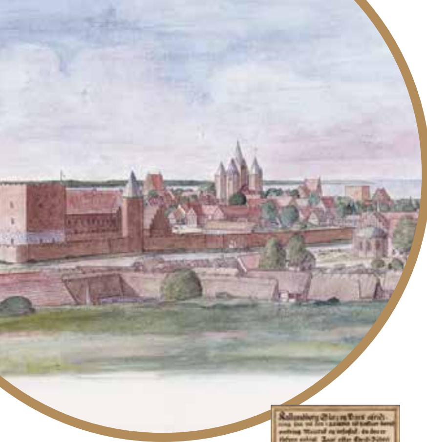
Kalundborg Blev en Tross stred. 1594. Den var den 11. januar 1594. Den blev erobret af Christian 4. af Danmark. Den blev derfor kaldet "Lars eller Freds-Tårn" 1594.