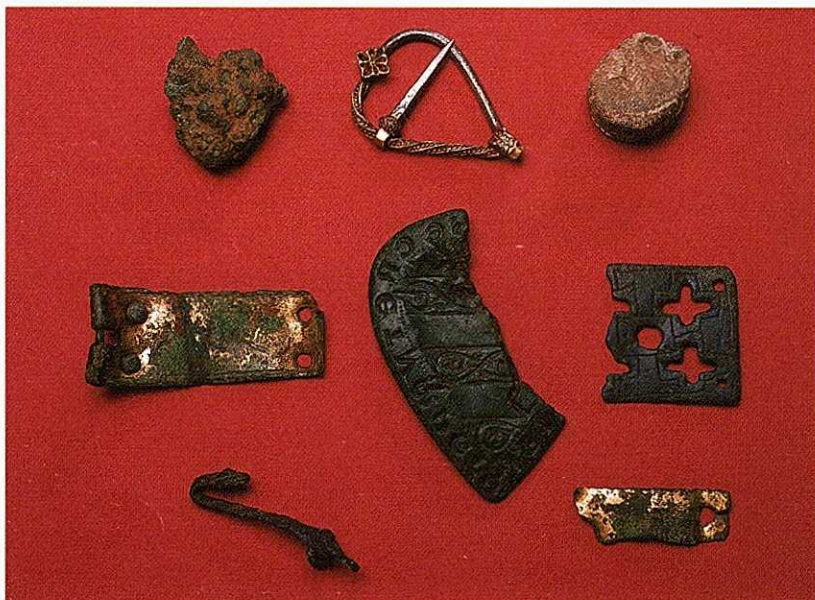
Fig. 3. "Skatten" opsamlet ved Lunden i 1990'erne. Steen Ahlgreen fandt foruden seglstampen og sølvsmykket også forskellige bronzespænder, hvoraf flere var forgyldte, et vægtlod og en støberest af bronze.