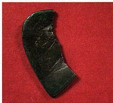
Fig. 4a. Seglstampe fra Lunden, forside. Stampen er 7 cm høj og har oprindeligt været 6 cm bred, men den øverste tredjedel er brækket af. Seglstamper var af største værdi og betydning i middelalderen. Deres aftryk havde juridisk gyldighed på samme måde, som en underskrift har det i dag.