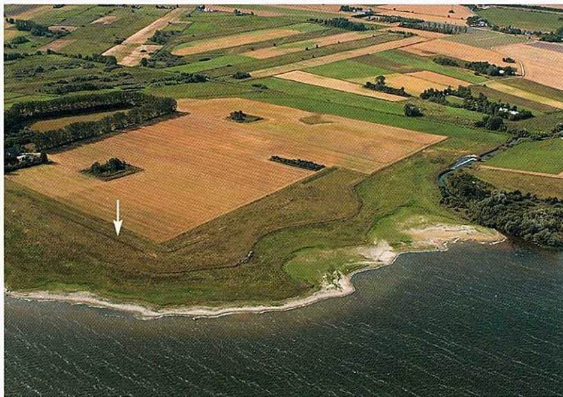
Fig. 1. Sæby Lund/Lunden set fra øst. Stedet ligger lige syd for Tissø's afløb i Nedre Halleby Å. Pilen markerer, hvor en ganske svag højning af munkestensbrokker dækker over fundamentsgrøfter til et stenhus fra 1200-årene.