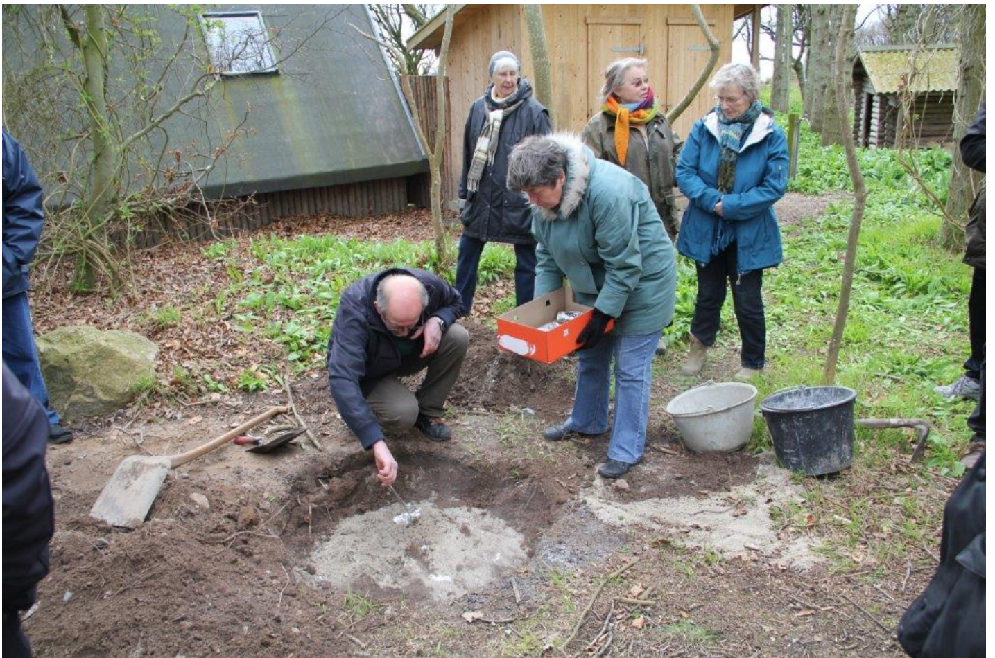
Kødet kommer frem i moderne indpakning...