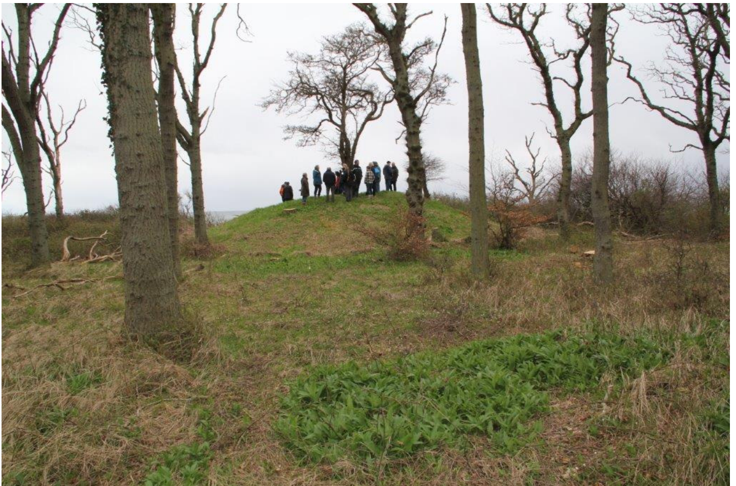
Her ses en af de plejede bronzealdergravhøje ved kysten