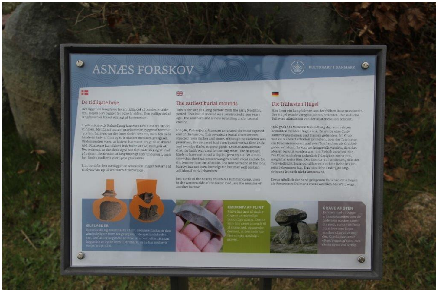
Endnu et af skiltene