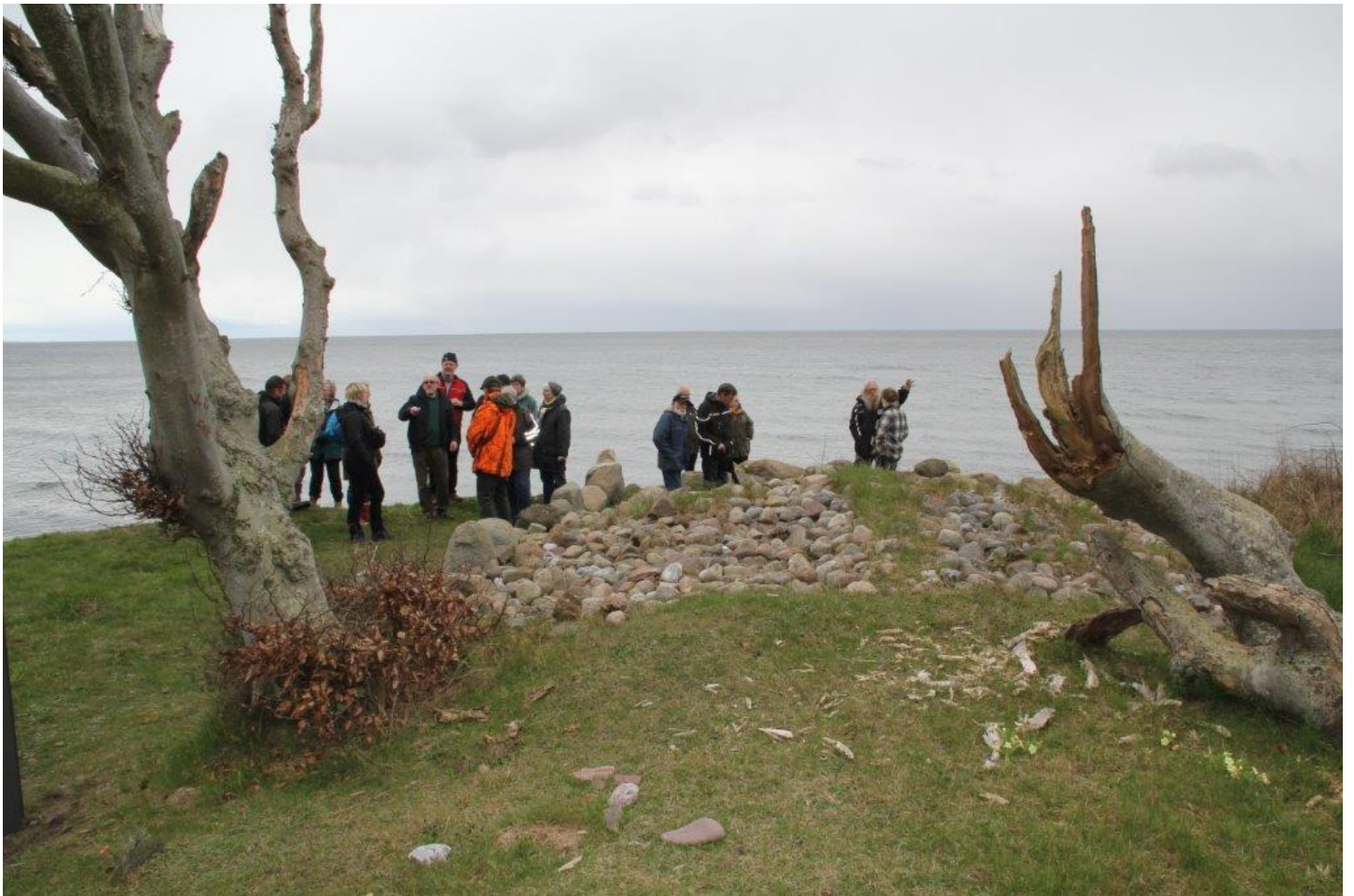
Her ses en meget fin stenalderlangdysse