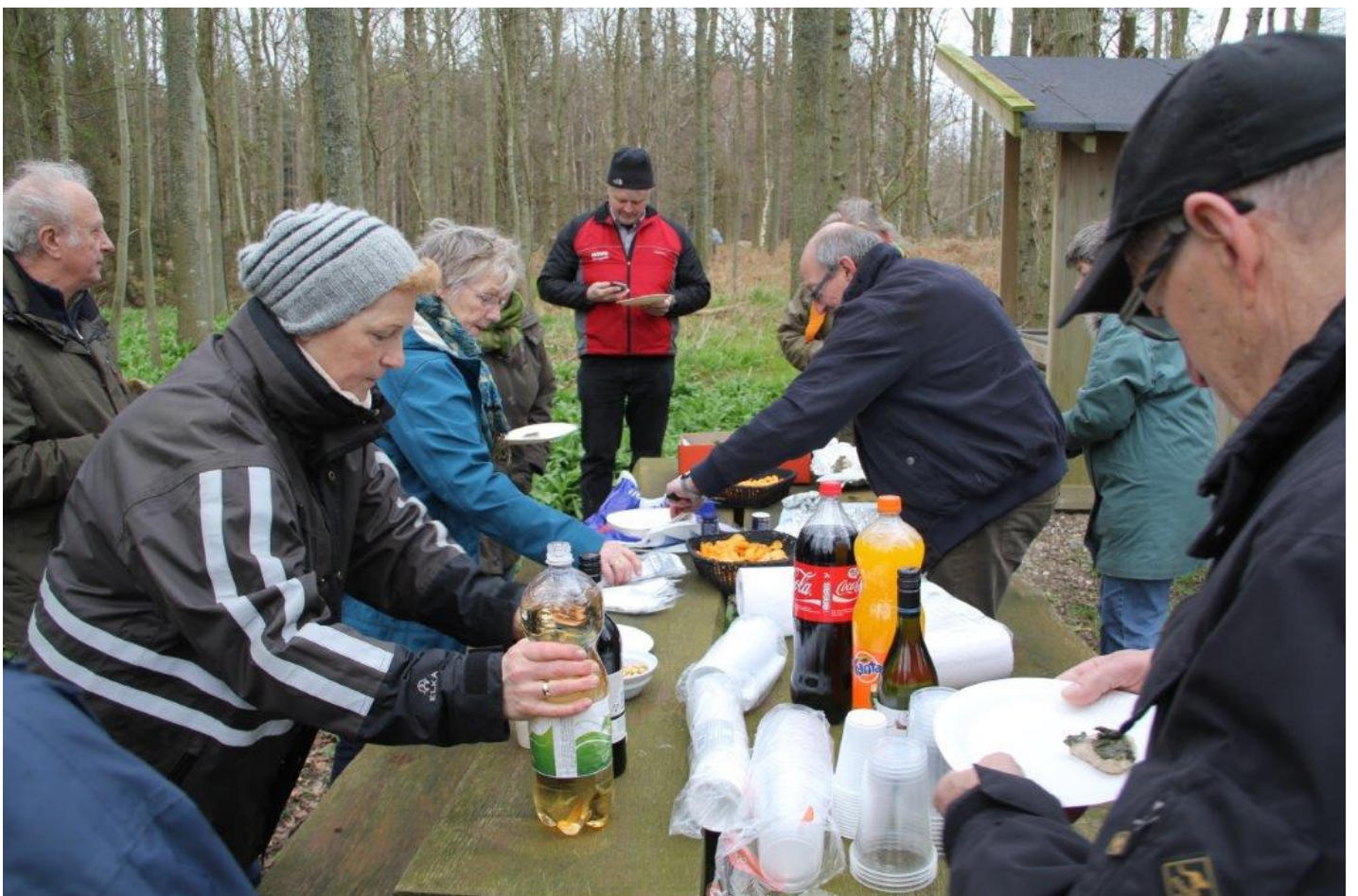
og nydes af gæsterne i fint vejr!