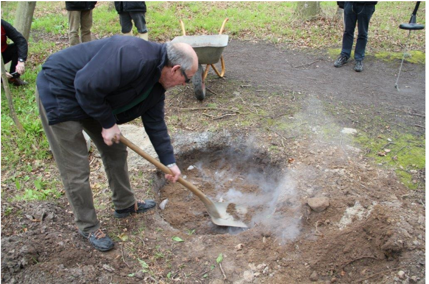
Kogestenene dækkes med indpakket kød og jord