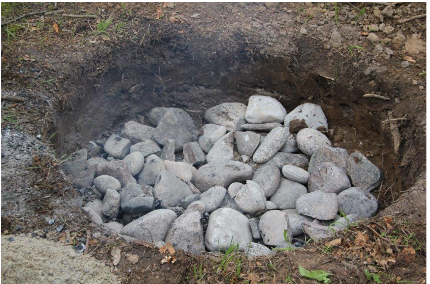
Kogestenene på plads