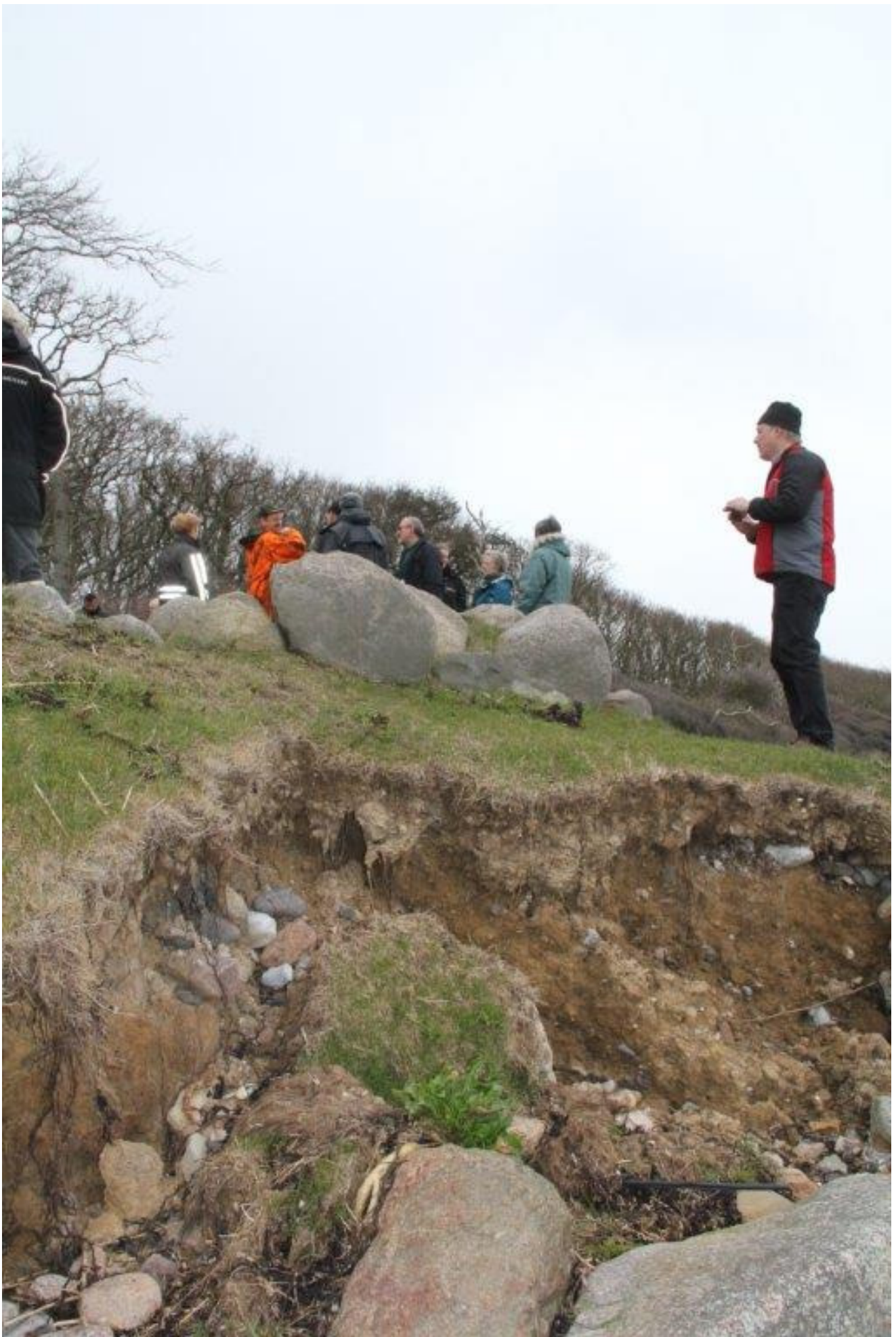
Desværre har langdyssen tydeligvis været udsat for kysterosion