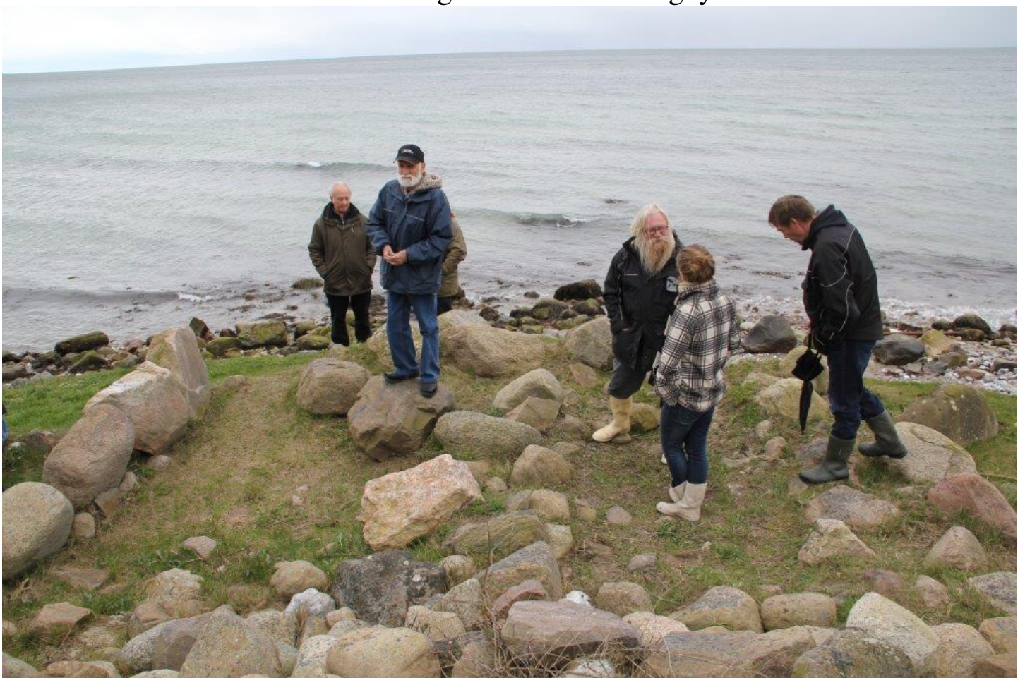
Den ligger helt ud til kysten