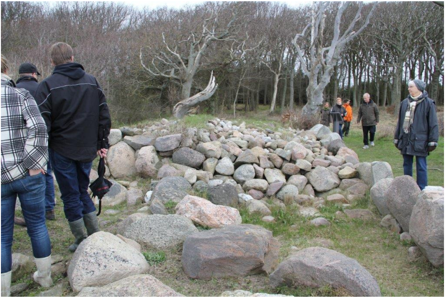
Langdyssens opbygning er ret tydelig