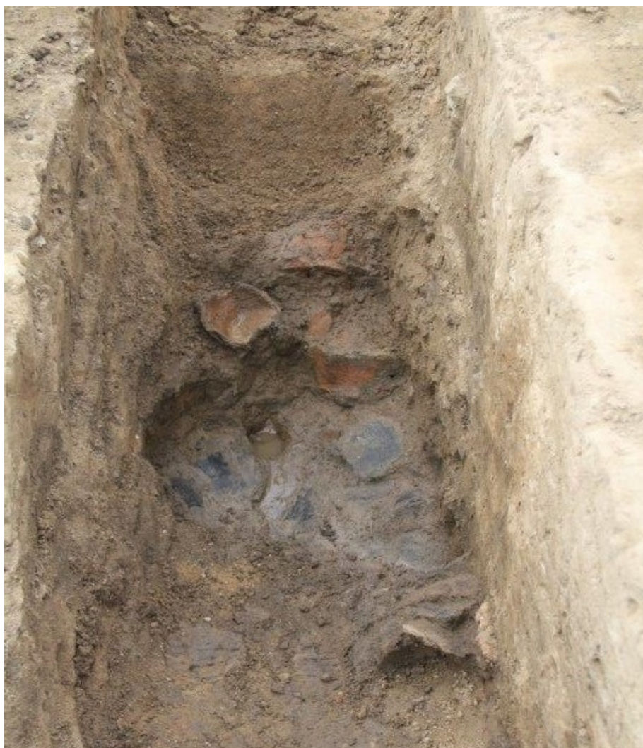
Her ses et af keramiklagene i den mest fundrige grube, der indeholdt flere lag med formentlig tidlig jernalder-potteskår