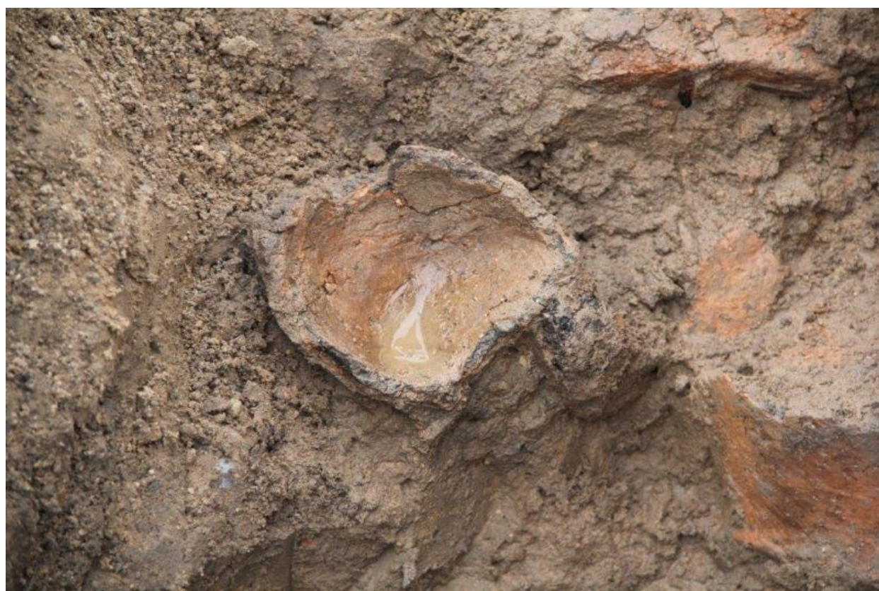
Detaljer af et lille kar/bæger