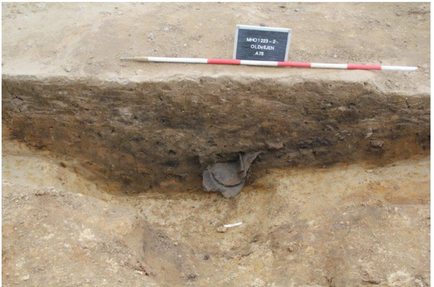
Grubens profil med store potteskår