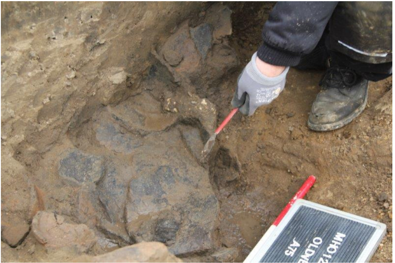
Optagning af potteskårene