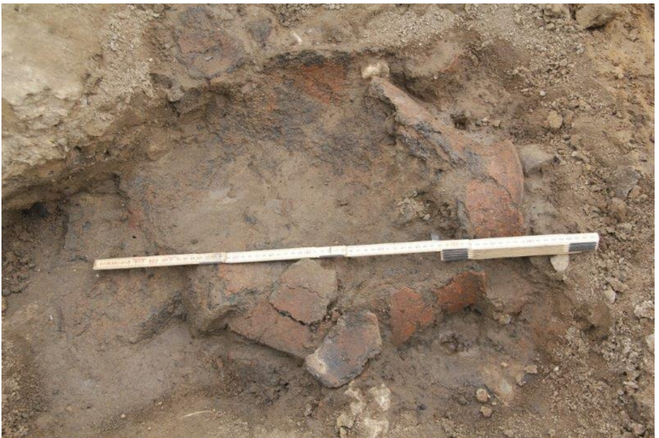
Her ses resterne af et stort fragmenteret kar, der har været 70-80 cm højt