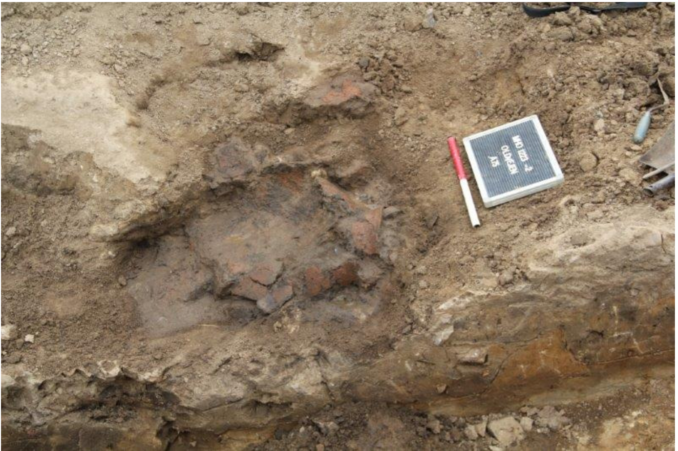
Endnu et lag potteskår i samme grube