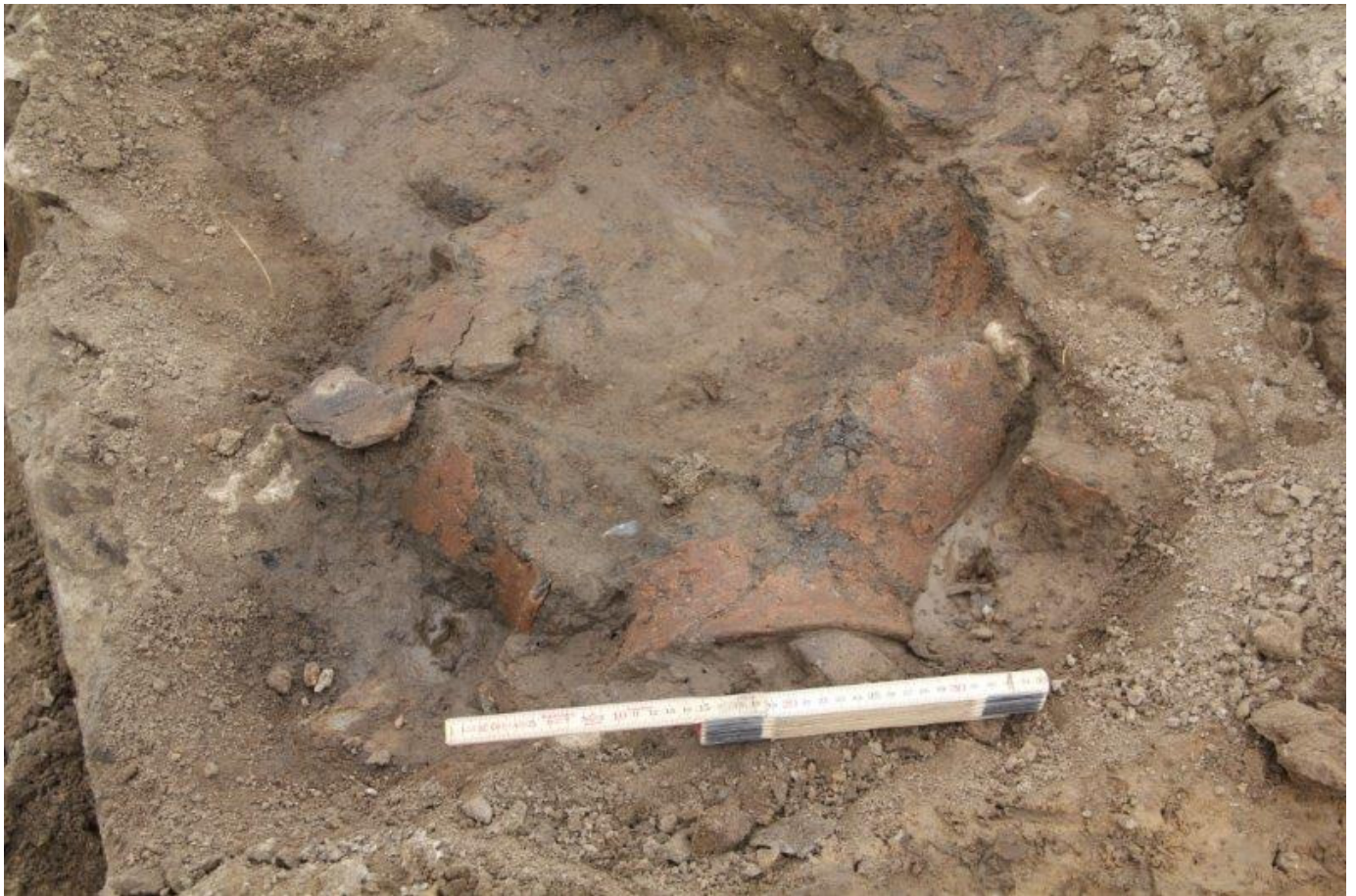
Randen er 20-30 cm i diameter