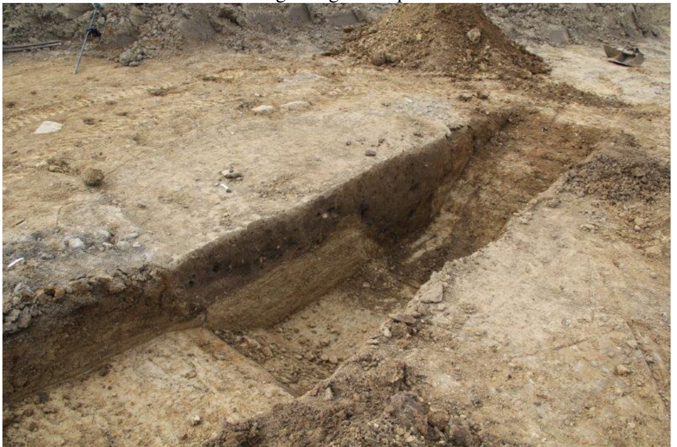
Profilen af en maskinsnittede grube