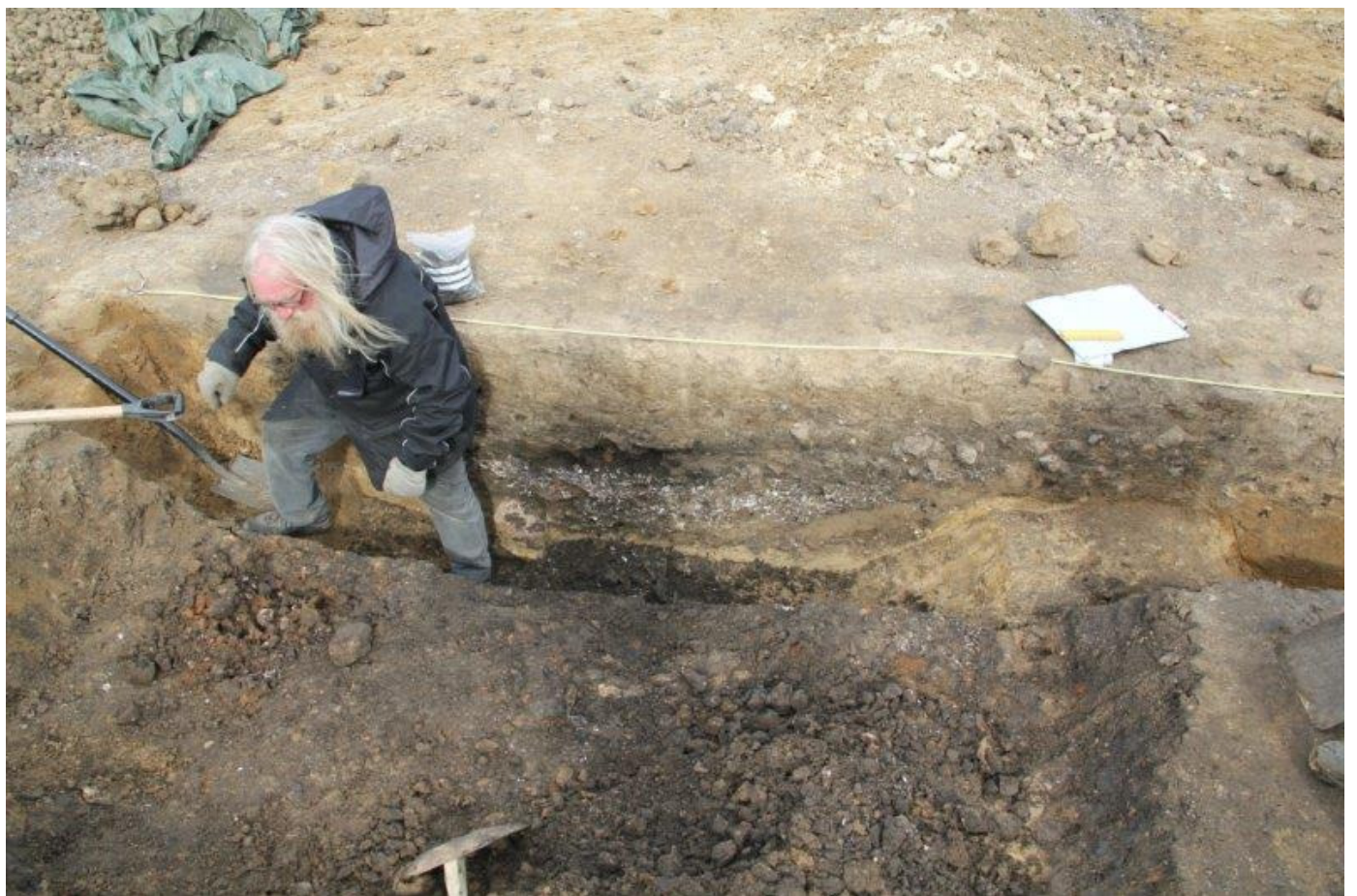
Profilen næsten parat til fotografering/tegning