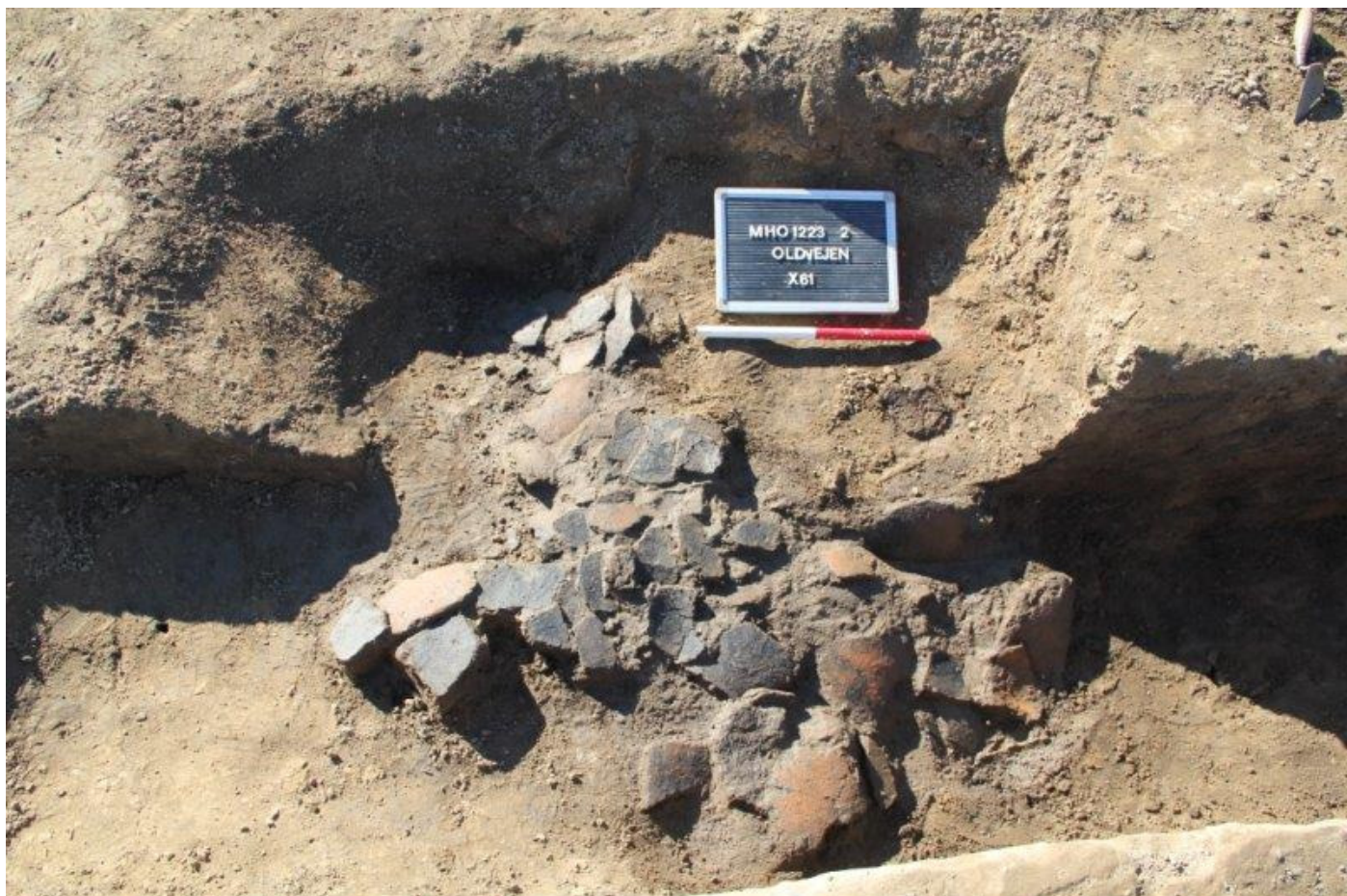
Et andet lag potteskår i samme grube