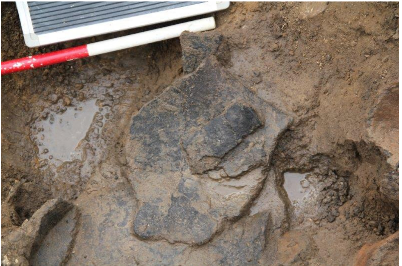
Et fint randskår fra et stort kar