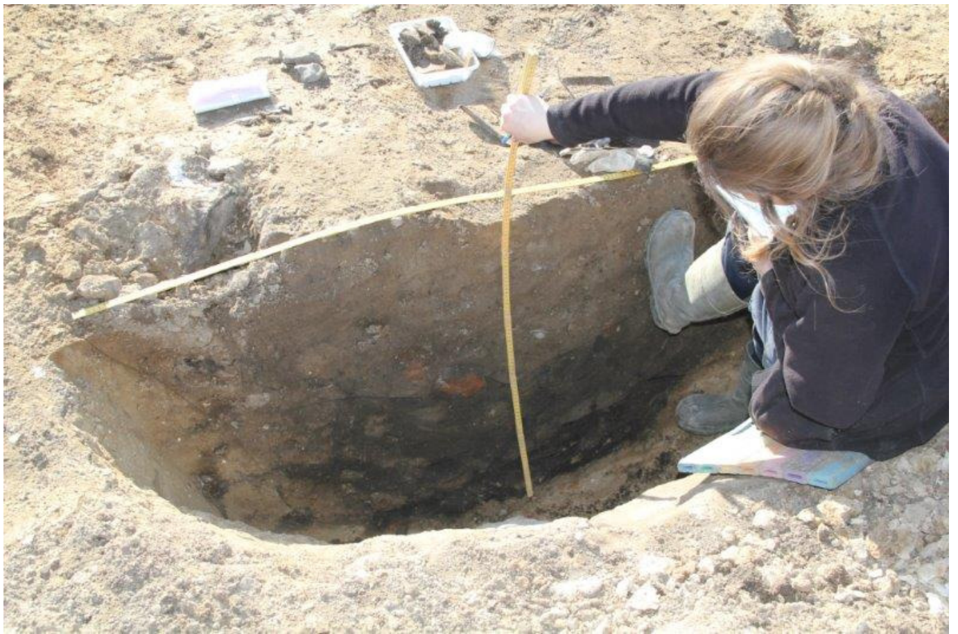
Lone tegner og måler profiler