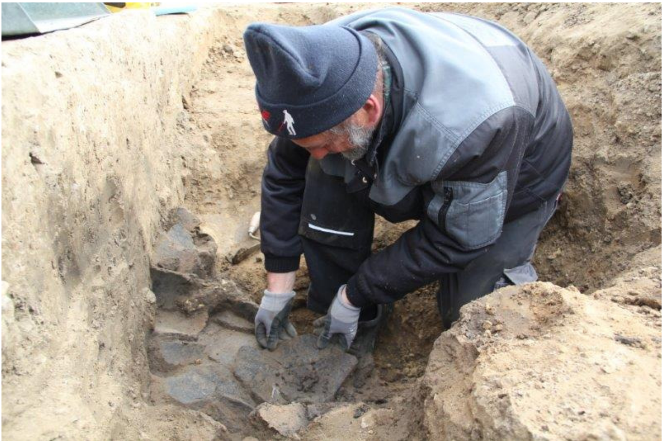
Optagning af det store randskår